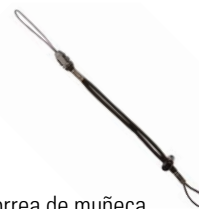
Correa de muñeca