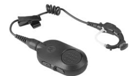
Auricular inalámbrico para operaciones esenciales

“Cuando vi por primera vez la Serie SL MOTOTRBO pensé que era un teléfono móvil, no una radio transmisora receptora. Tiene todas las capacidades de una radio transmisora receptora pero con un aspecto profesional y discreto que encaja a la perfección con todos nuestros uniformes”.