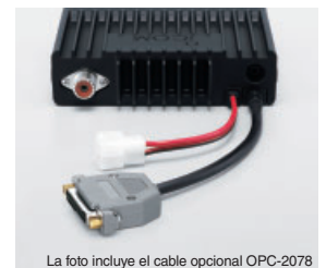
La foto incluye el cable opcional OPC-2078

El cable opcional ACC le permite conectar con varios dispositivos externos para el control de la salida de audio, entrada de modulación, control remoto de canal, claxon y muchas más funciones. El OPC-1939 es del tipo D-SUB de 15 pins y el OPC-2078 es del tipo D-SUB de 25 pins.